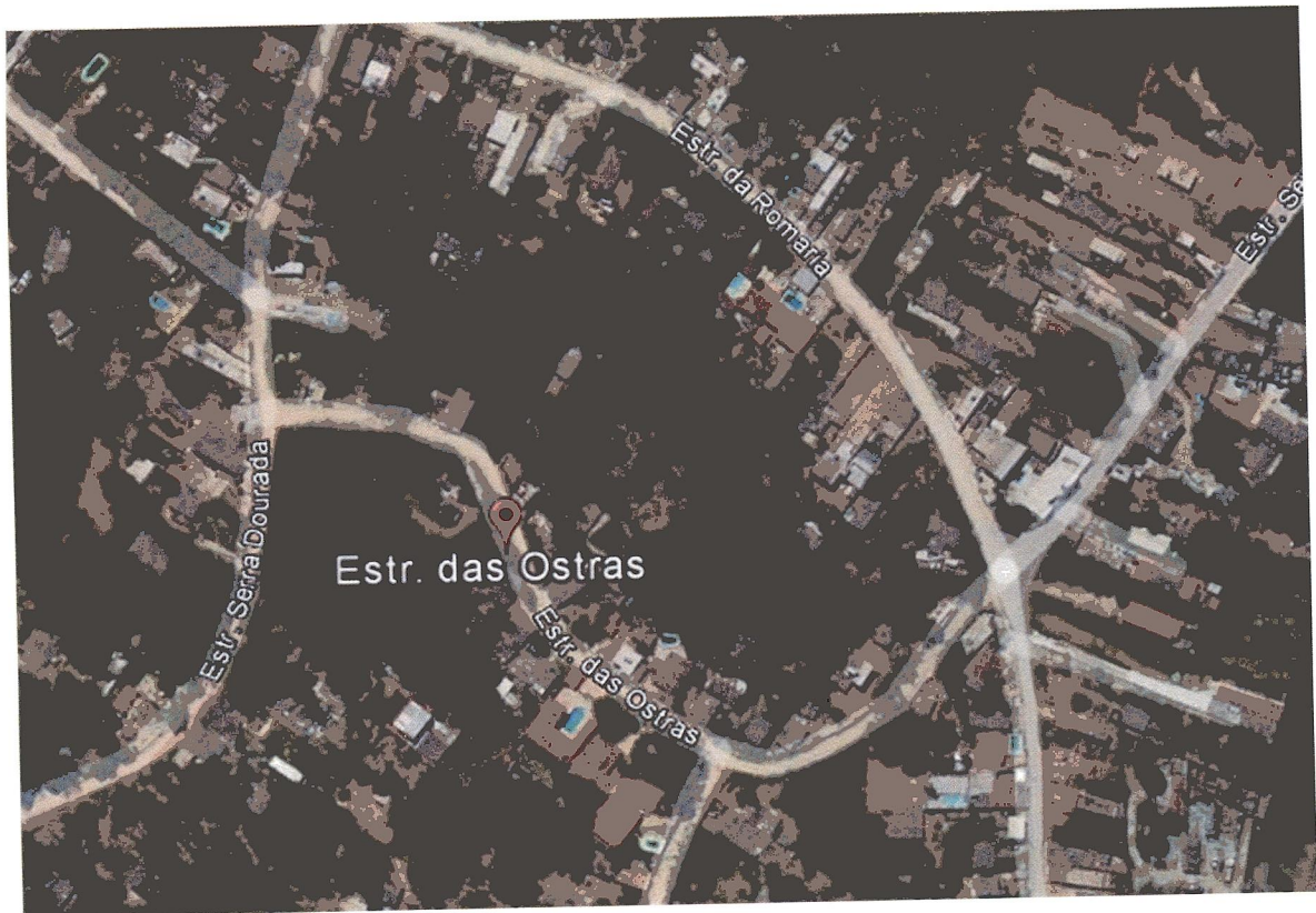
Croqui de Localização da Estrada das Ostras, Chácara Mont Serrat Bloco F