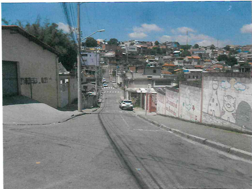
Fim da Travessa do Simão (Rua sem saída)