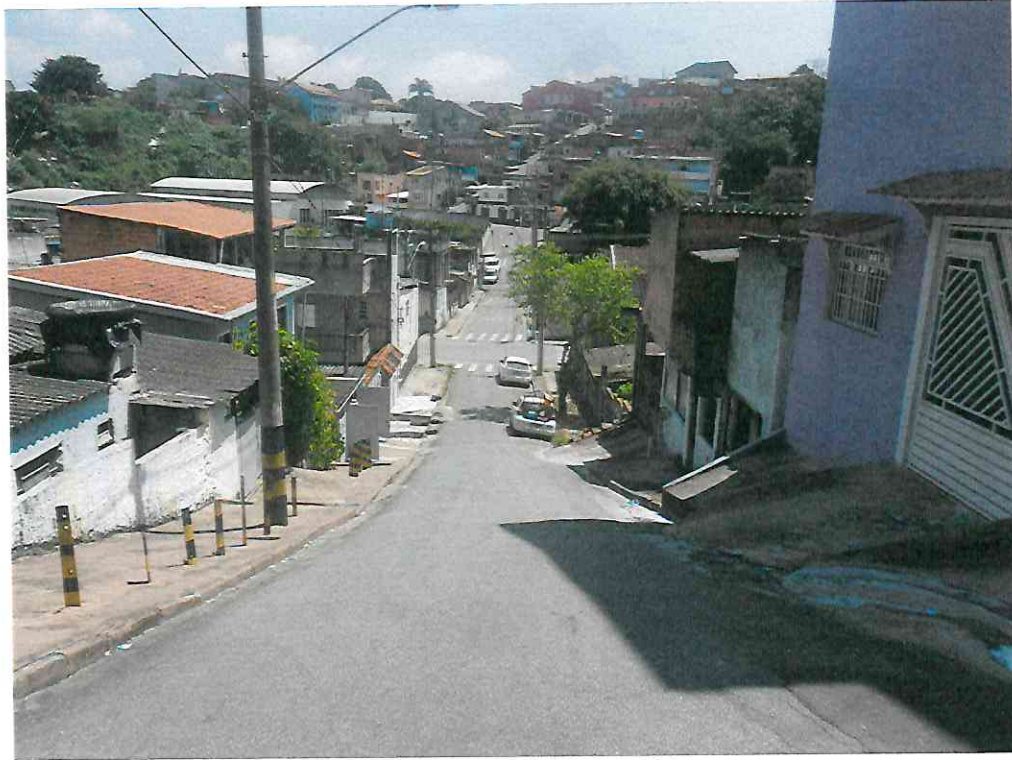
Início da Travessa do Simão

PREFEITURA MUNICIPAL DE ITAPEVI SECRETARIA DE DESENVOLVIMENTO URBANO E HABITAÇÃO Rua Agostinho Ferreira Campos, 675– Jardim Nova Itapevi | Itapevi | São Paulo | CEP: 06693-120 Tel.: (11) 4143-7600 | sdu@itapevi.sp.gov.br