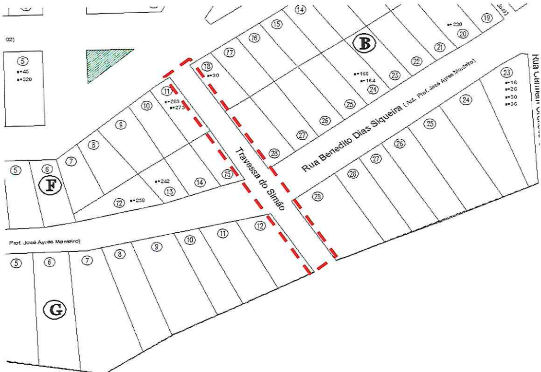
Trecho da planta de loteamento do Jardim Rainha

Rua Agostinho Ferreira Campos, 675- Jardim Nova Itapevi | Itapevi | São Paulo | CEP: 06693-120 Tel.: (11) 4143-7600 | sdu@itapevi.sp.gov.br