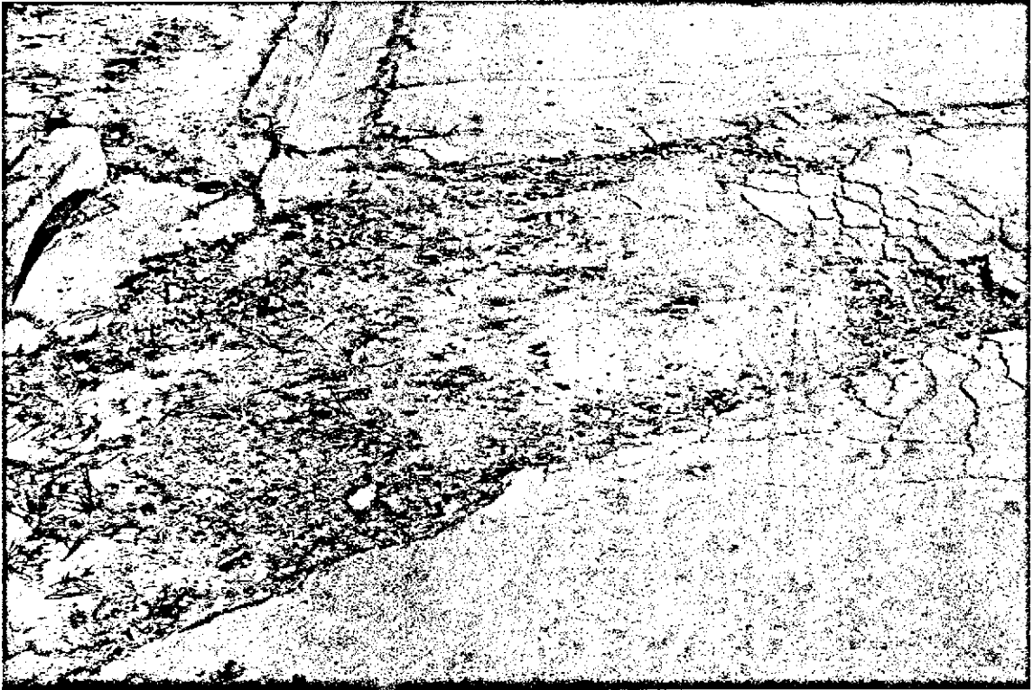
(FOTOS 1 - 4) JARDIM SÃO CARLOS - Rua Neyde Silva Guimarães - Galeria de esgoto que passa por debaixo do asfalto está com uma das tubulações danificada, sendo assim, asfalto está cedendo e abrindo cratera. (em frente a casa n.º 44)