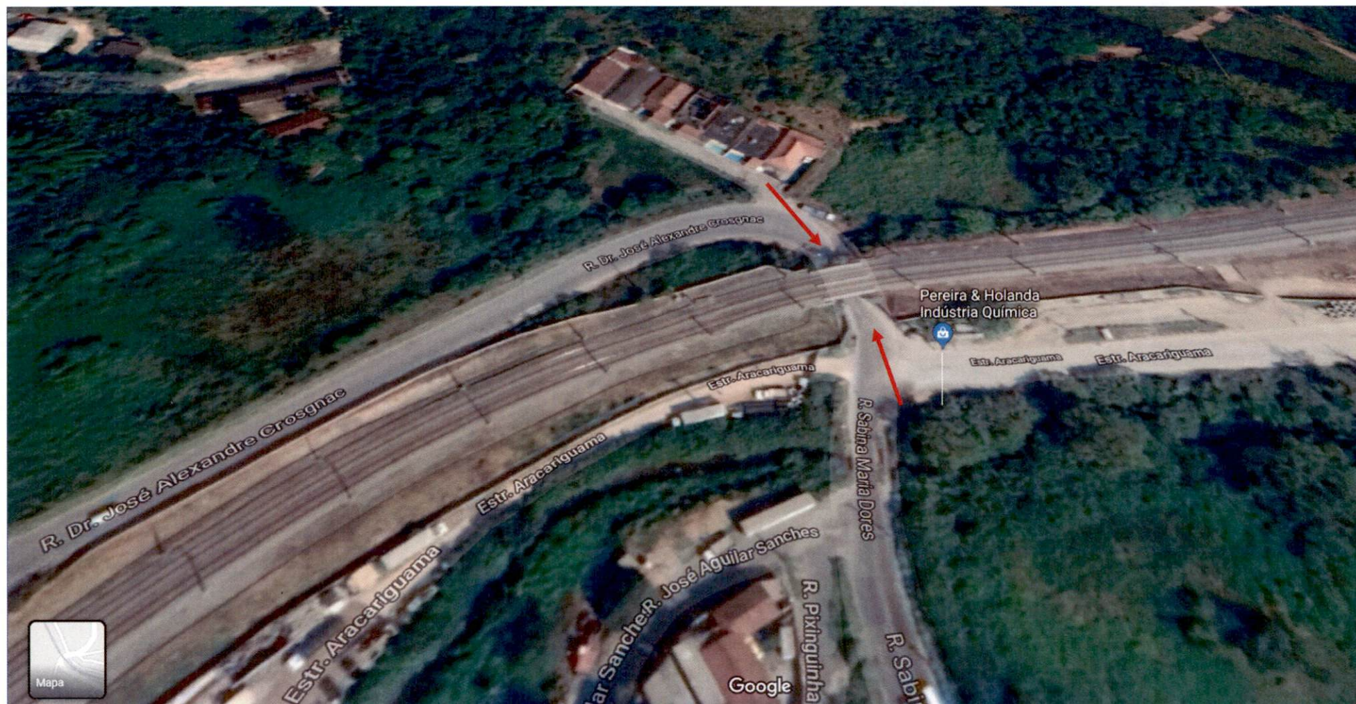
CROQUI REQUERIMENTO 124 / 2021