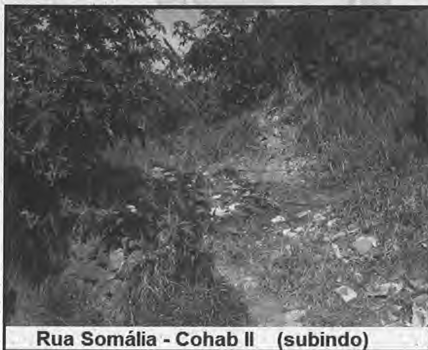
Rua Somália - Cohab II (subindo)