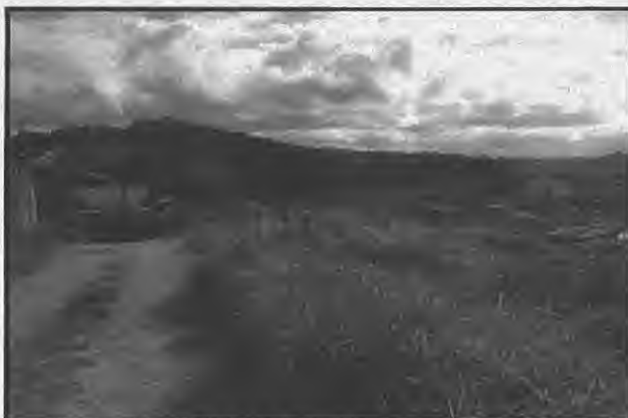
Rua Luiz Belli - Cohab II (descendo sentido Rua Somália)