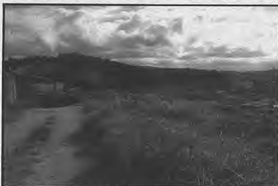
Rua Luiz Belli - Cohab II (descendo sentido Rua Somália)