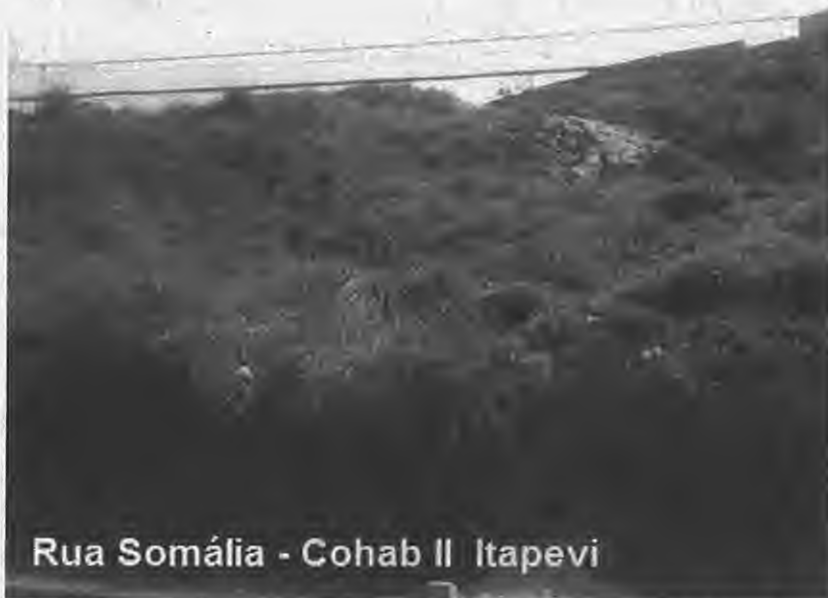
Rua Somália - Cohab II Itapevi