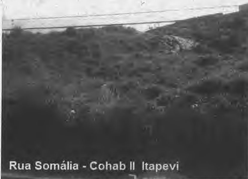
Rua Somália - Cohab II Itapevi