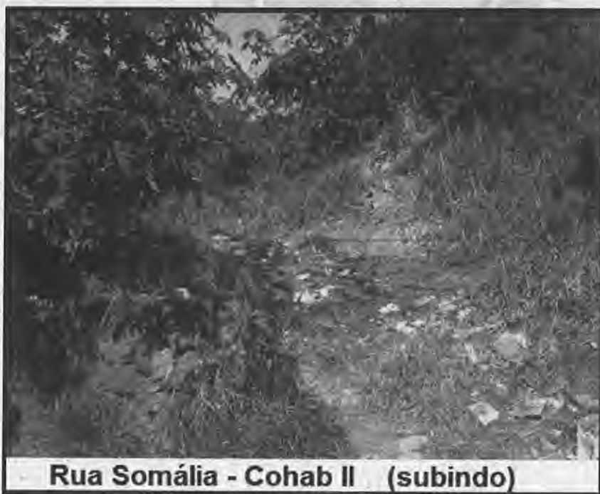
Rua Somália - Cohab II (subindo)