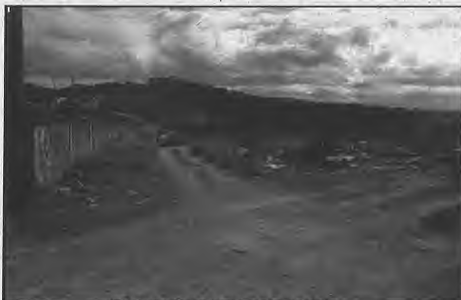
Rua Luiz Belli - Cohab II (descendo sentido à Rua Somália)