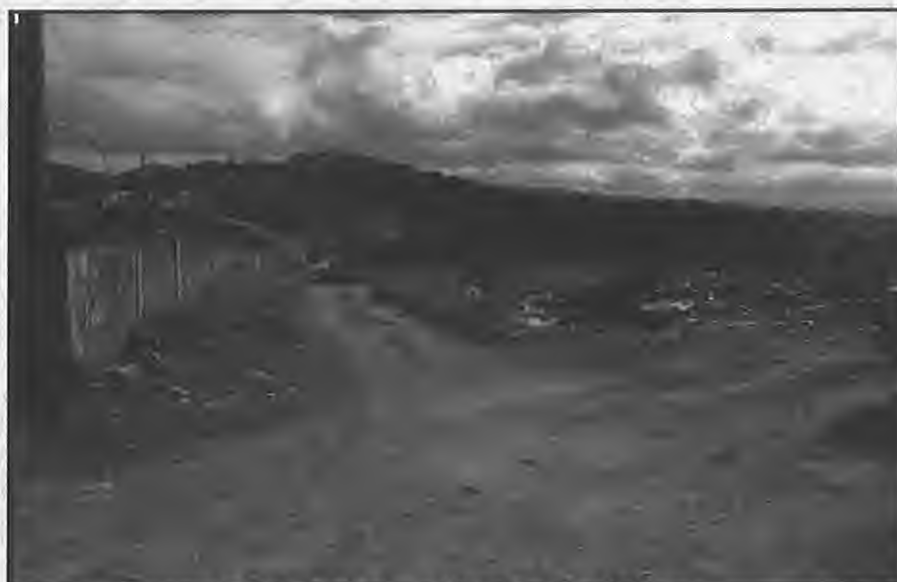
Rua Luiz Belli - Cohab II (descendo sentido à Rua Somalia)