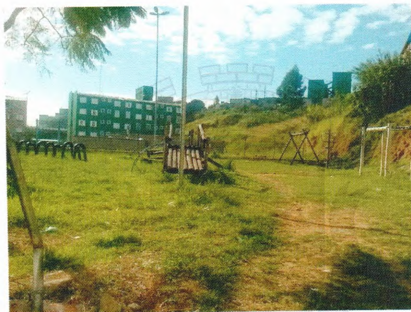
Foto do terreno atrás da UBS