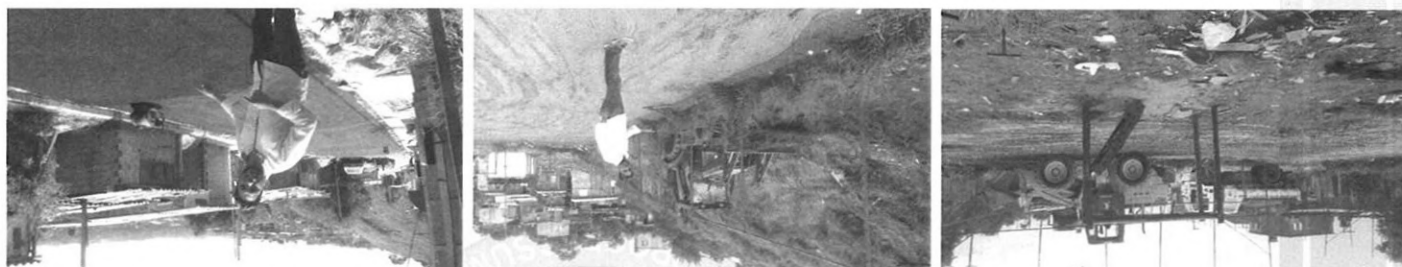
Morro do Quiabo - sonho de legalização e reurbanização