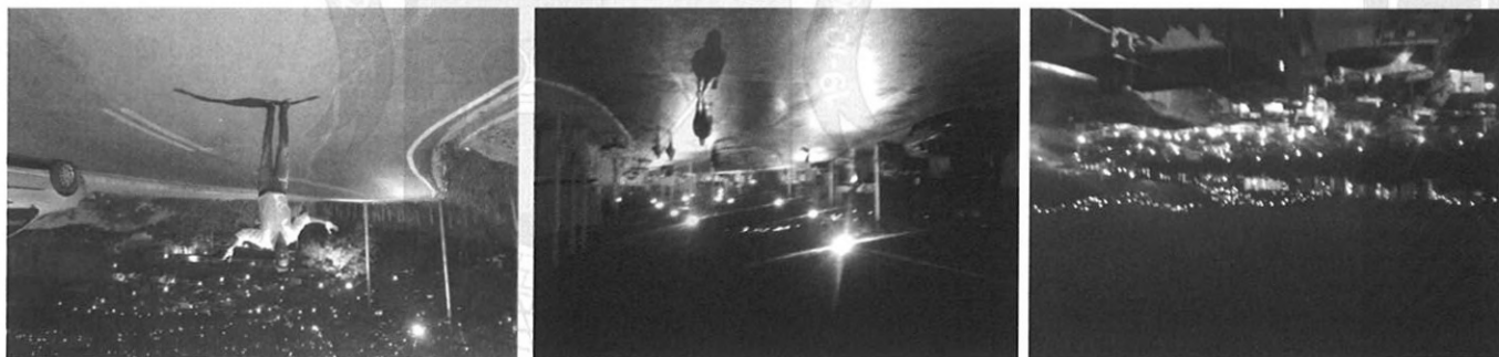
Areião legalizado e reurbanizado