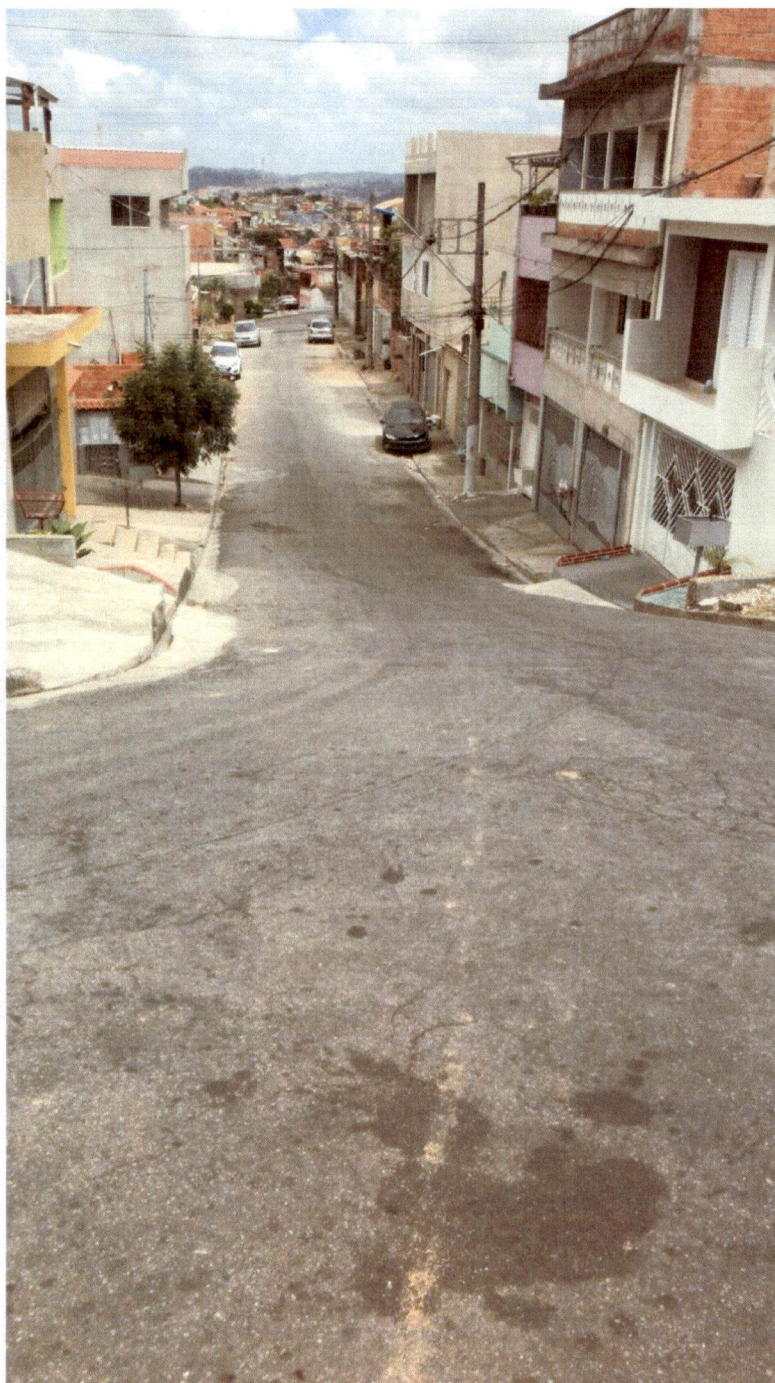
Rua Ouro Fino, altura do nº 65 – Jardim Bela Vista