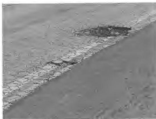
Rua São Judas Tadeu

Como dito anteriormente, o trecho é itinerário de ônibus municipal aumentando a dificuldade para todos os envolvidos, ou seja, condutores, passageiros, moradores e pedestres.