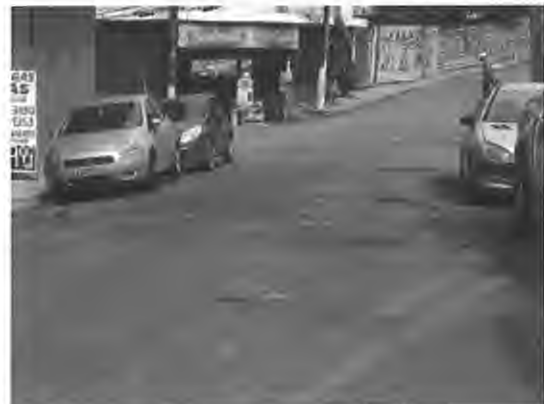
Fotos da Rua Ana Maria Vaz