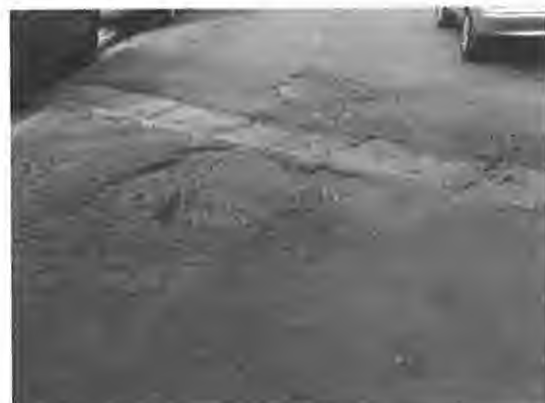
Rua Francisco Manoel de Oliveira

A deterioração além de dificultar o ir e vir de pessoas, danifica veículos e motocicletas que trafegam diariamente por essa via muitas vezes realizando manobras perigosas e colocando em risco não só seu patrimônio, como também, a segurança de pedestres.