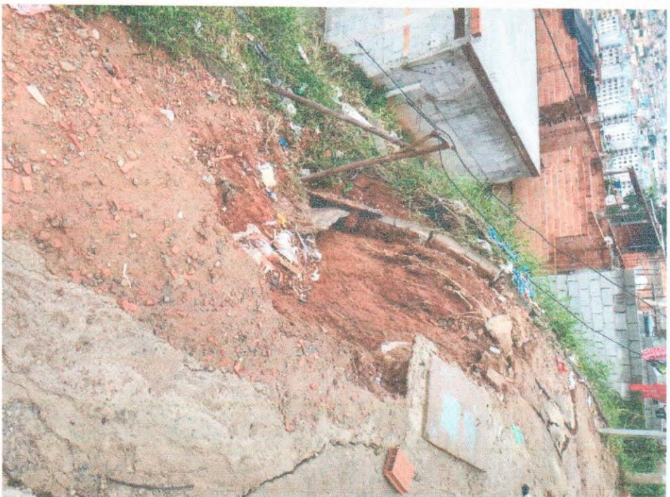
Muro de Contenção