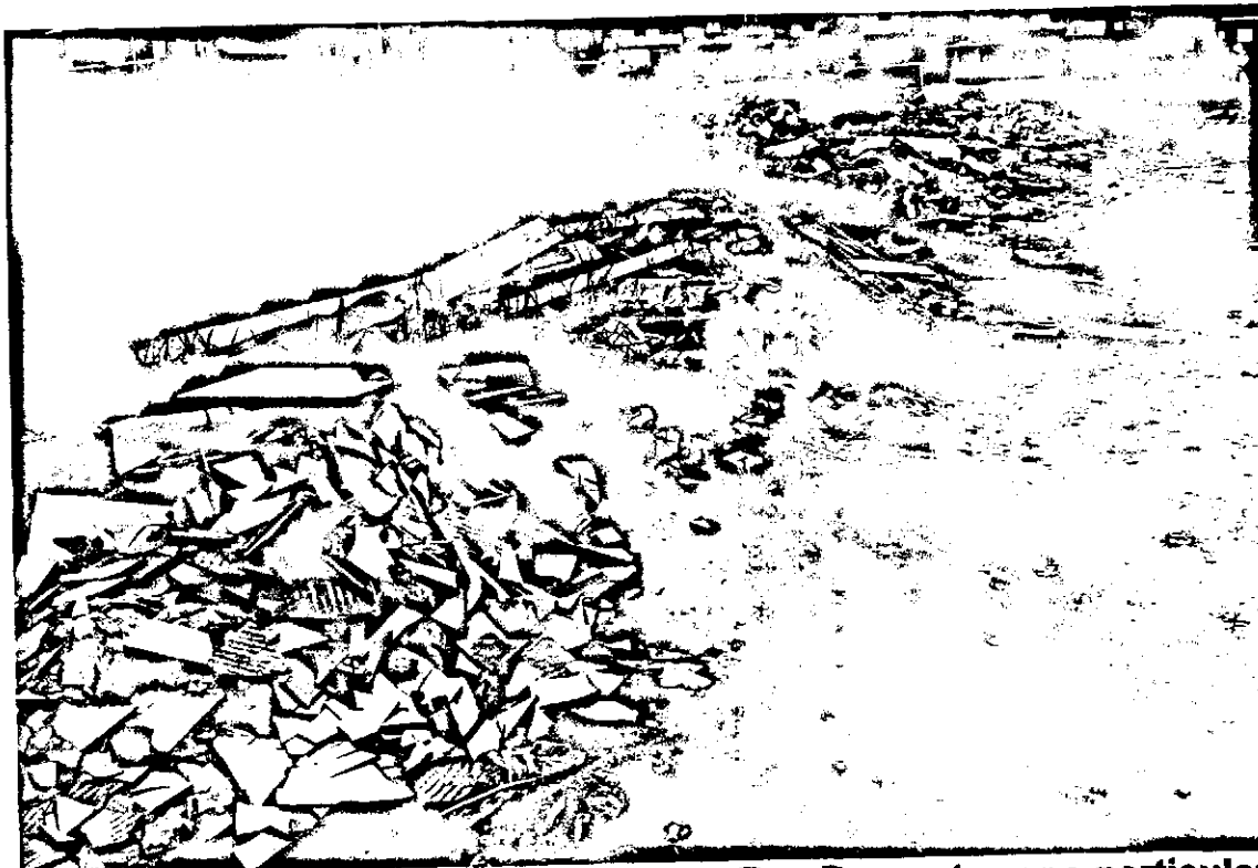
(FOTOS 1 - 4) JARDIM SÃO CARLOS - Rua Bagre, terreno particular em frente ao nº 06 e 04 A, moradores solicitam limpeza e remoção de entulhos.