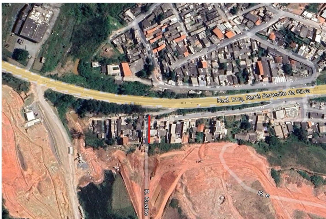
Croqui de Localização Rua 4, Chacáras Jacucaí, Itapevi-SP