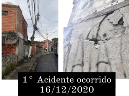
1° Acidente ocorrido 16/12/2020

recorrentes prejuízos materiais, como poderá ser visto nas imagens abaixo são inúmeros os casos de acidentes que ocorrem no local, em vídeos e notícias divulgadas em páginas locais que comprovam a gravidade da situação, sendo possível verificar a repetição dos fatos e o impacto direto na segurança da população.