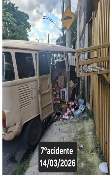
7º acidente 14/03/2026