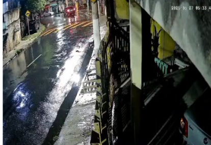
6º acidente 27/06/2025