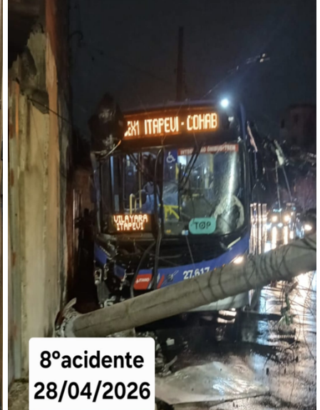
8º acidente 28/04/2026