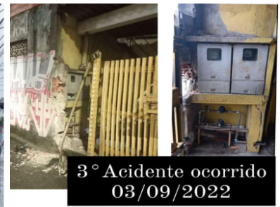
3° Acidente ocorrido 03/09/2022