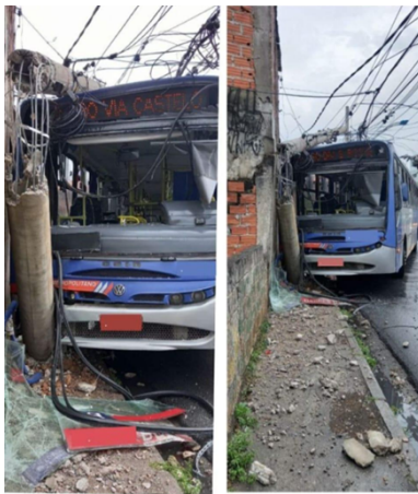
2° Acidente ocorrido 01/10/2021