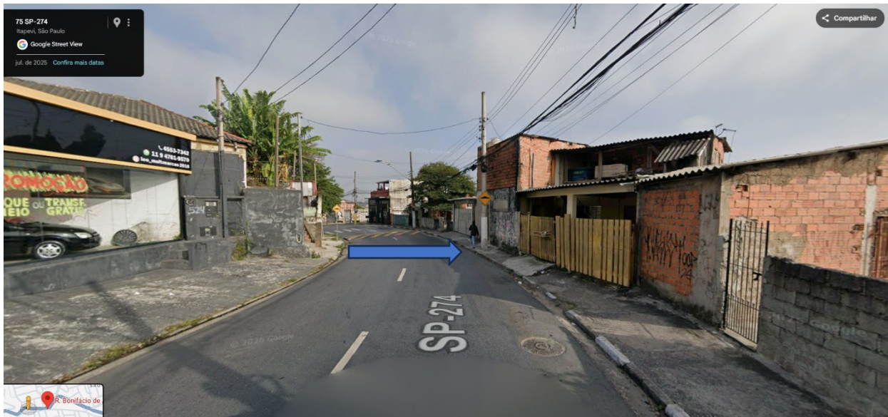
Curva perigosa, prejudicando a residência e risco de acidente com pedestre