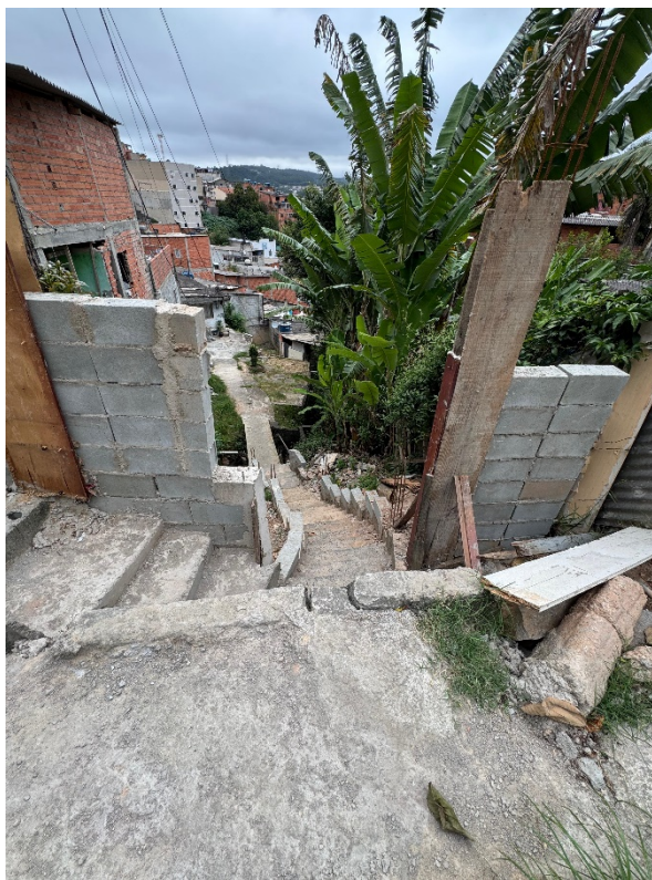
Modelo que já existe na mesma rua do outro lado