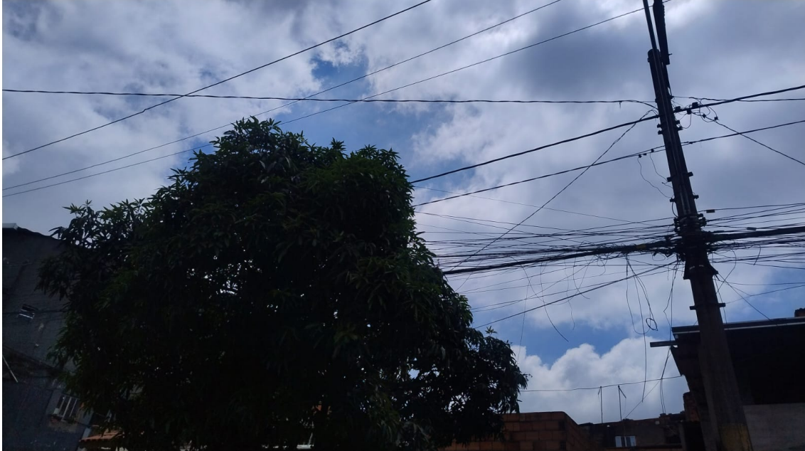
Exemplar tocando a fiação.