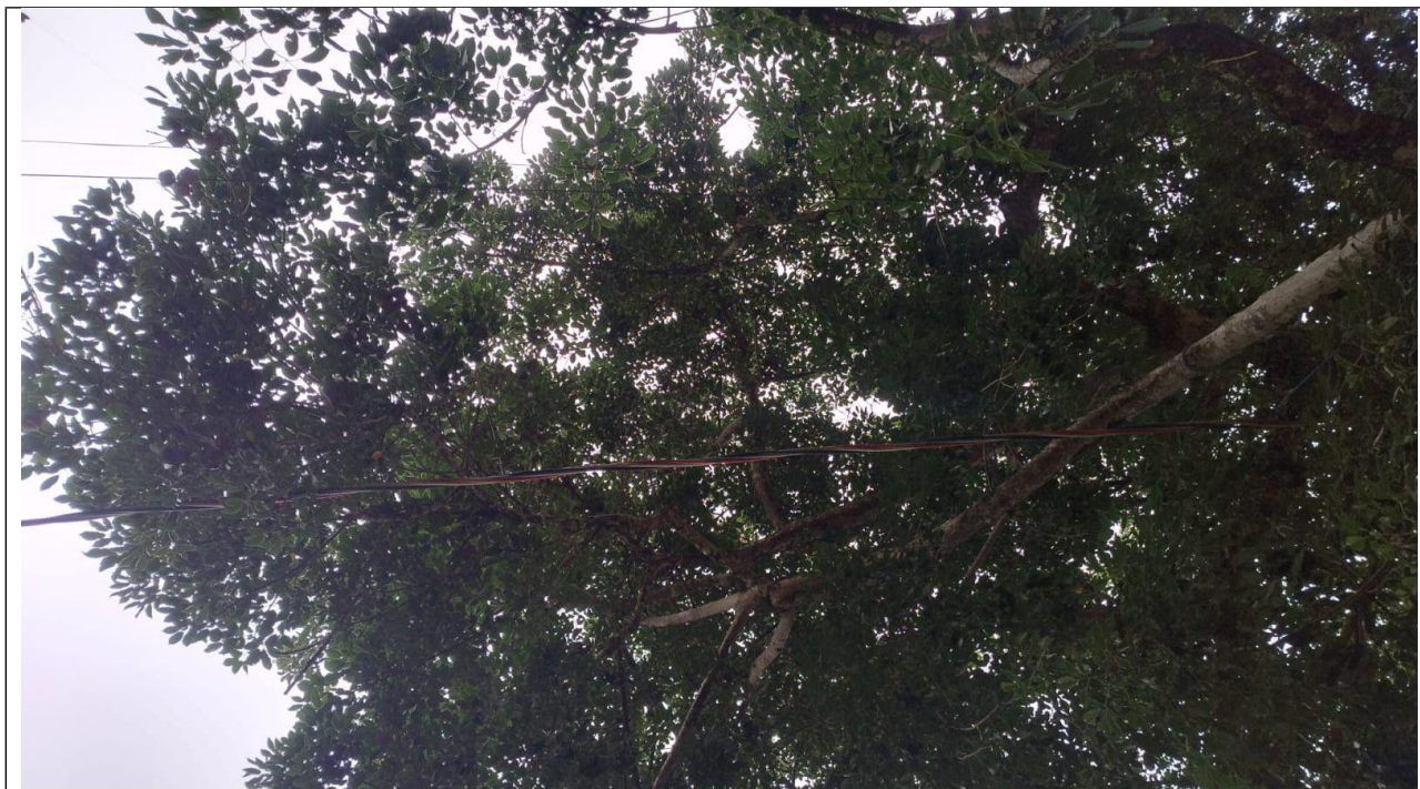
Exemplar tocando a fiação.

PREFEITURA MUNICIPAL DE ITAPEVI SECRETARIA DE MEIO AMBIENTE E DEFESA DOS ANIMAIS Rua Heloisa Hideko Koba, 21 – Jardim Nova Itapevi | Itapevi | São Paulo | CEP: 06694-180 Tel.: (11) 4205-4345 | sma@itapevi.sp.gov.br