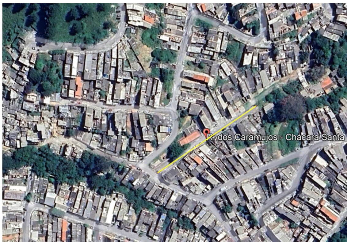
Rua dos Caramujos (antiga Rua 5), Chácara Santa Cecilia