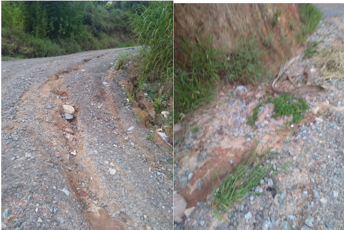
Estrada da Romaria