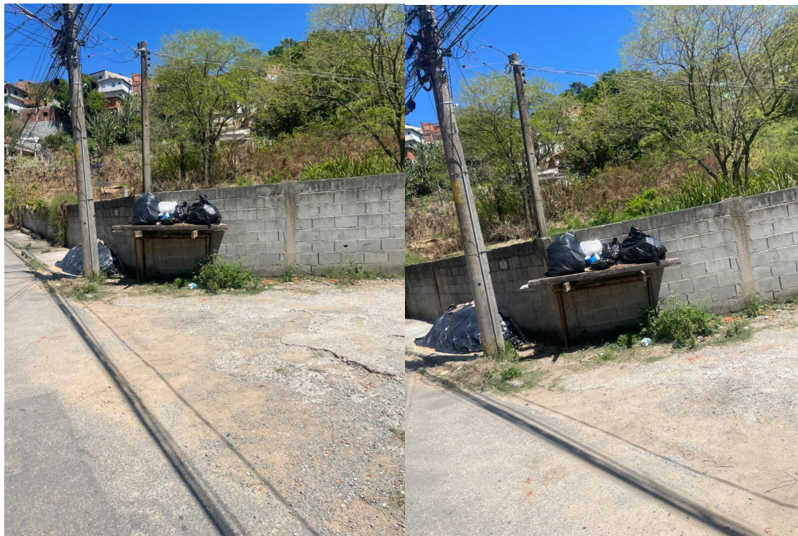
Alt. nº 162

Indicação Nº 5283/2025 - Documento assinado digitalmente em 23/10/2025. PROTOCOLO 18586/2025 - 23/10/2025 15:31 - Para ver o arquivo original acesse http://siave.camaraitapevi.sp.gov.br/Sino.Siave/documentos/autenticar e informe a chave: F479-J056-888M-CJ78