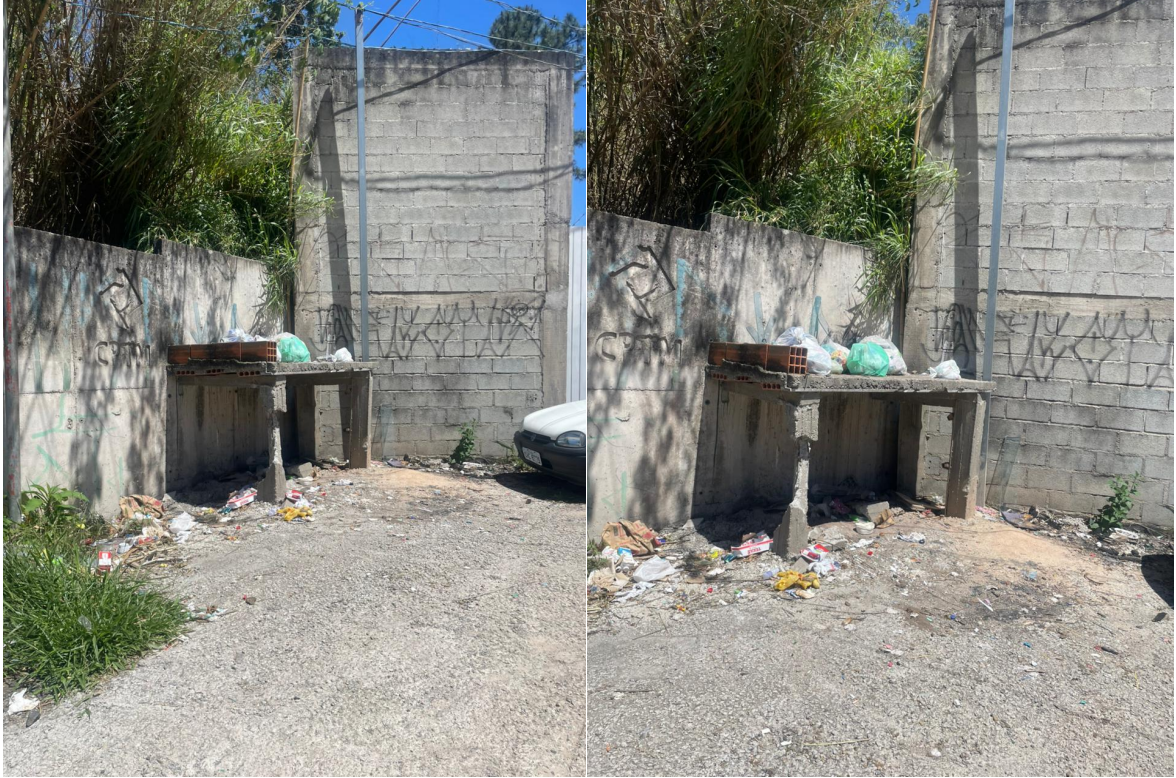
Alt. nº 13

Indicação Nº 5283/2025 - Documento assinado digitalmente em 23/10/2025. PROTOCOLO 18586/2025 - 23/10/2025 15:31 - Para ver o arquivo original acesse http://siave.camaraitepevi.sp.gov.br/Sino.Siave/documentos/autenticar e informe a chave: F479-J056-888M-CJ78