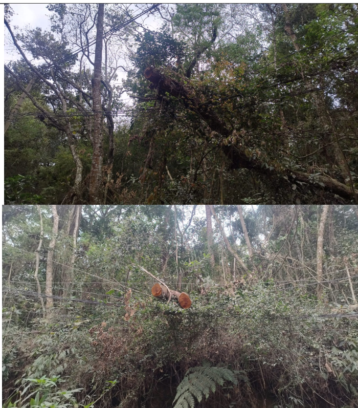
Exemplares tocando a fiação.

PREFEITURA MUNICIPAL DE ITAPEVI SECRETARIA DE MEIO AMBIENTE E DEFESA DOS ANIMAIS Rua Heloisa Hideko Koba, 21 – Jardim Nova Itapevi | Itapevi | São Paulo | CEP: 06694-180 Tel.: (11) 4205-4345 | sma@itapevi.sp.gov.br