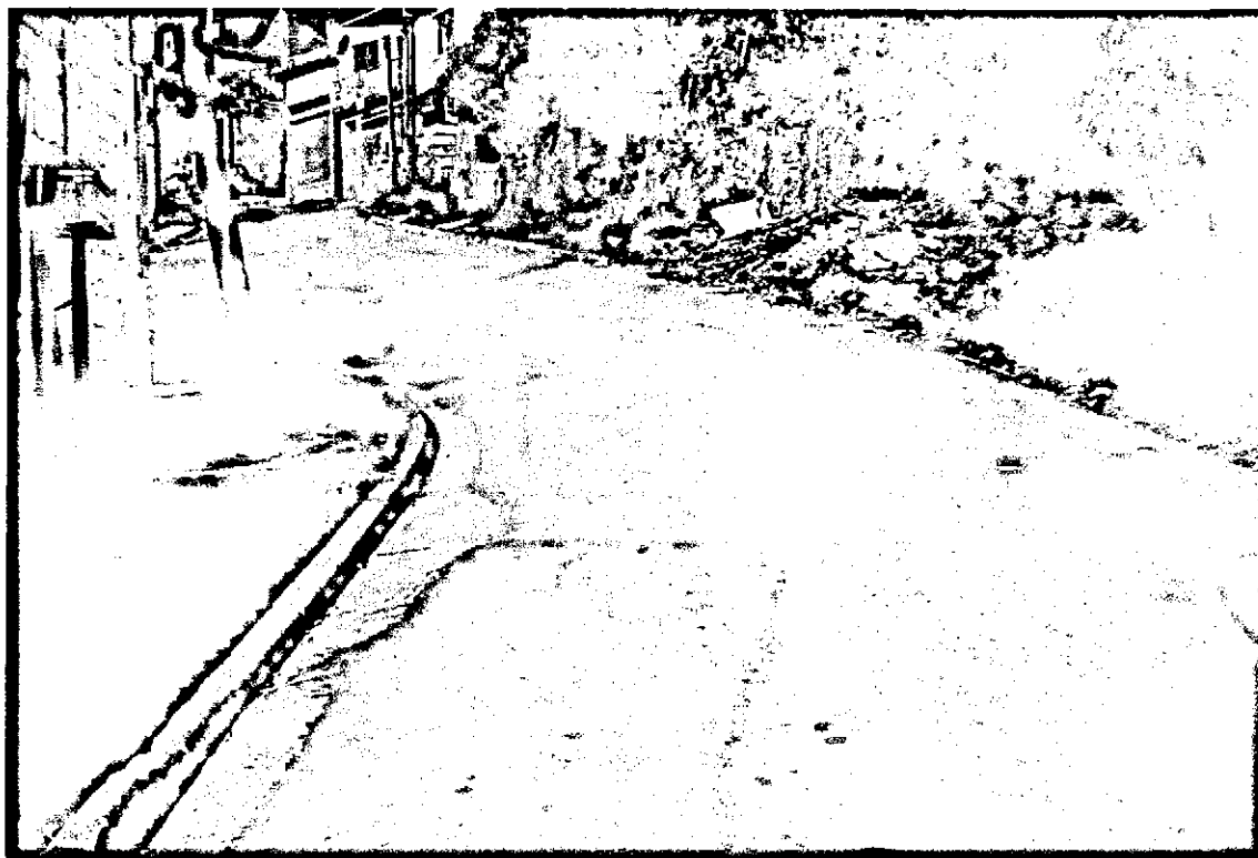
Jardim São Carlos – Rua Arraia – moradores solicitam lombada em frente a Casa nº 11 devido a alta velocidade de veículos que circulam pelo local