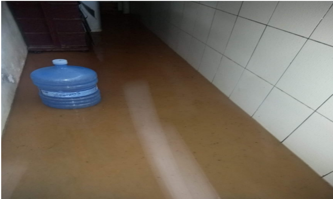
Donizetti Dias Carvalho Vereador “Zetti da Adega”

Requerimento Nº 1846/2023 - Documento assinado digitalmente em 10/10/2023. PROTOCOLO 16131/2023 - 10/10/2023 13:23 - . Para ver o arquivo original acesse http://siave.camaraitapevi.sp.gov.br/Sino.Siave/documentos/autenticar e informe a chave: 9EKJ-0004-J515-NAFU