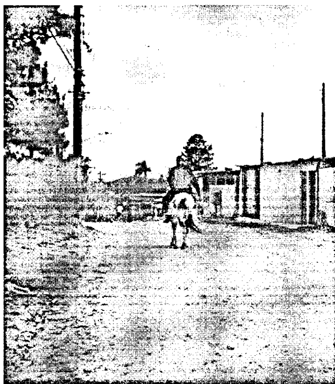
Homem anda a cavalo em rua sem asfalto, em Itapevi

Quando chove, a lama e as poças d'água dificultam o caminho, carros de pequeno porte e ônibus não conseguem transitar em muitos trechos.