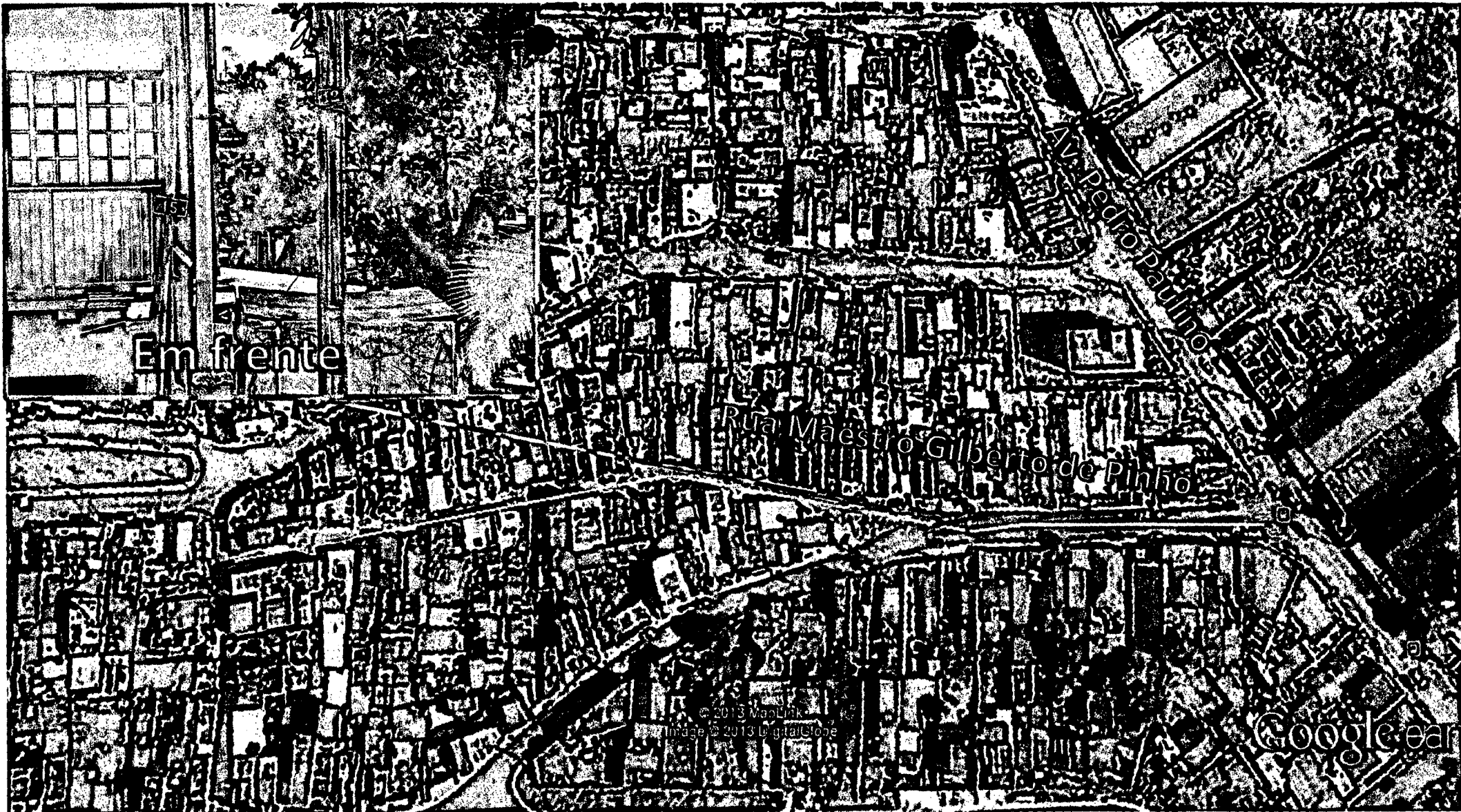
CROQUI DA INDICAÇÃO 651/2013